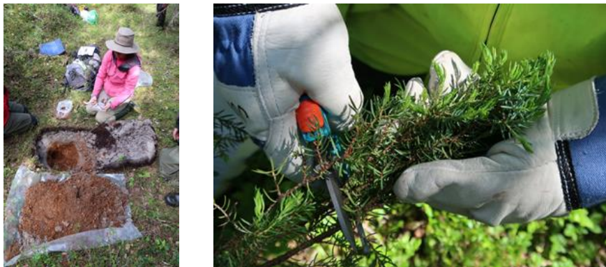
Figura 2. Muestreo de suelo (izquierda) y plantas (derecha).

La financiación de la UE del proyecto Horizonte 2020 NEXT ofrece la oportunidad de probar material de muestreo no convencional con un impacto medioambiental extremadamente bajo, como la nieve y los fluidos transpirados de plantas o árboles, con fines de exploración minera.