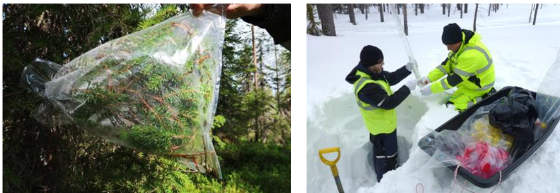
Figura 3. Muestreo de fluidos transpirados de picea abies (izquierda) y de nieve (derecha).